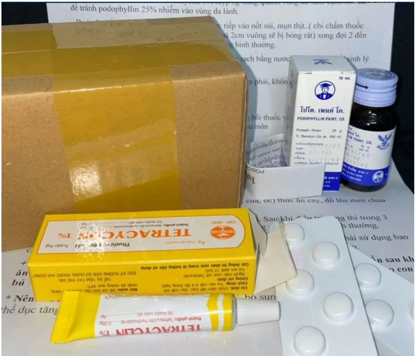
27 Hình ảnh sùi mào gà giai đoạn đầu ở Nam, Nữ, Thuốc chữa trị Sùi Mào Gà Podophyllin 25 tại nhà