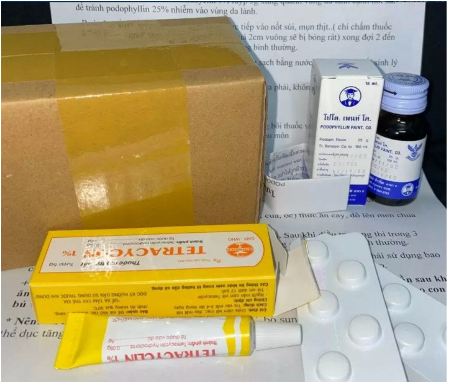
Thuốc trị liệu Sùi Mào Gà Podophyllin 25, 27 Hình ảnh sùi mào gà giai đoạn đầu ở Nam, Nữ

trưng chuyên dẫn tới tình trạng u nhú trên niêm mạc da người với hơn 120 chủng dòng không giống nhau. song, chỉ một ít trong số đó dẫn đến Bệnh lý sùi mào gà.