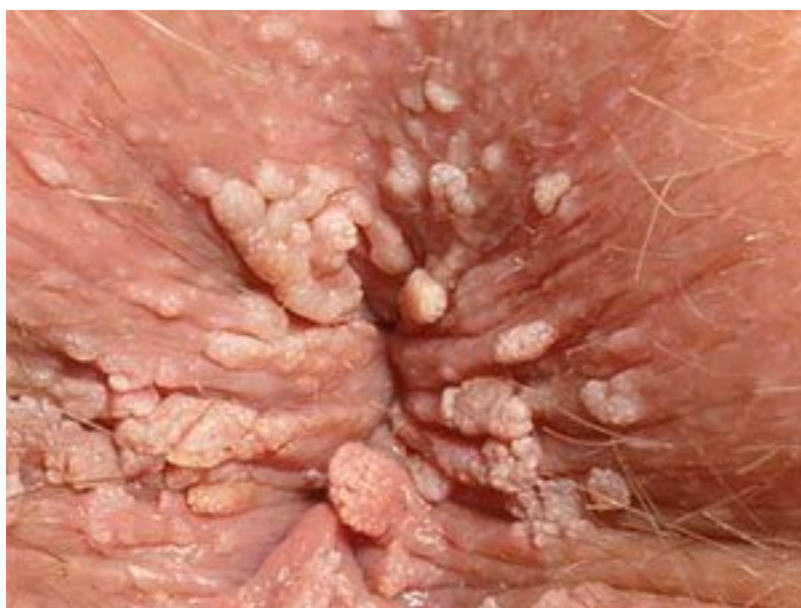
27 Hình ảnh sùi mào gà giai đoạn đầu ở Nam, Nữ

Bên cạnh sùi mào gà tại sinh dục. Chúng ta còn thấy sùi mào gà ở hậu môn. do vậy, hình ảnh sùi mào gà ở hậu môn cũng toàn bộ có thể tìm ra được. đây là hiện trạng mọc mụn tại vùng hậu môn. tuy vậy mụn này hao hao những mụn mọc ở các vị trí khác. Đặc điểm là mụn thịt mọc tại những khu vực không giống nhau ở vùng hậu môn.